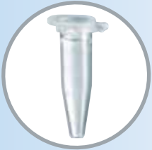
● セーフ - ロックチューブ