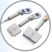
● 電動ピペット Xplorer